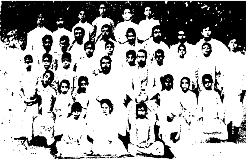
ব্রহ্মচার্য বিদ্যালয়ের ছাত্র ও অধ্যাপকগণসহ রবীন্দ্রনাথ