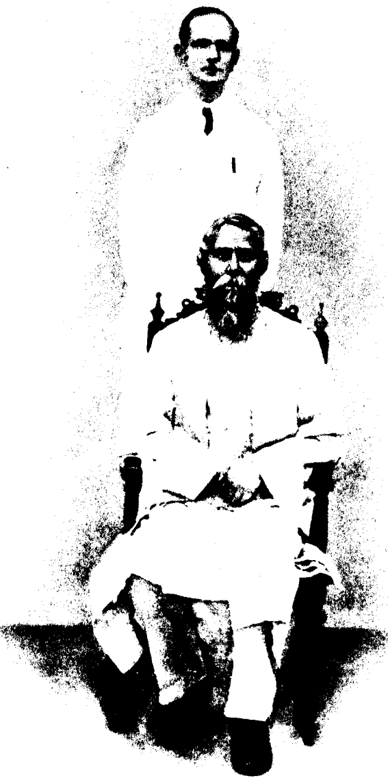
রবীন্দ্রনাথ ও পিয়ার্সন