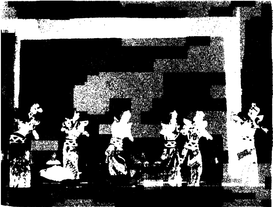
শাস্ত্রনিকেতনের ছাত্রছাত্রীগণ কর্তৃক তাদের দেশের অভিনয়