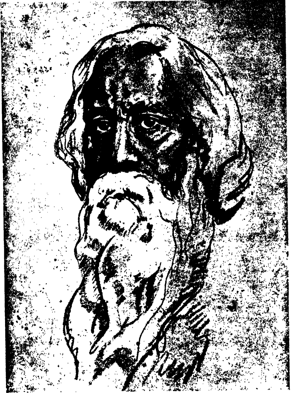
রবীন্দ্রনাথ। ১৯২৬ কে. মাৎসুহারা - অঙ্কিত